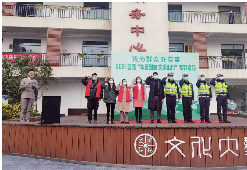
“社区文明交通宣讲队”宣誓。

“我们将积极倡导文明交通新风尚,共同营造辖区‘安全、畅通、有序、和谐’的道路交通环境!”12月13日,成都市公安局交通管理局联合华西社区传媒主办的“我为群众办实事”2021成都首届“车管到家 文明出行”系列活动,在成都市武侯区金花桥街道金花社区拉开序幕。