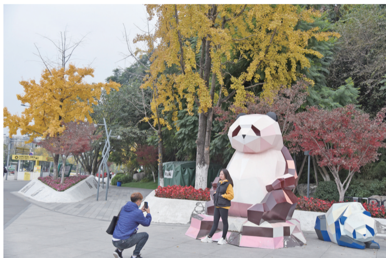
人人都爱和“滚滚”合影。