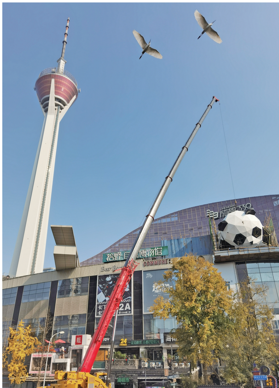
“大熊猫”又上楼啦!