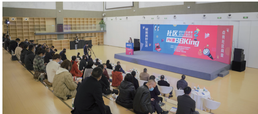
“社区BBKing”PK赛第九场海选赛现场。

串珠成链的社区商业场景,是如何点亮双流社区居民美好生活的?12月3日,在成都市双流区委社治委主办的第二届寻找“社区BBKing”活动现场,人们找到了答案!活动当天,社治专家、社区主讲人、居民代表齐聚西航港街道辖区的“中公书馆”,聚焦“社区商业”话题,畅聊双流社区商业的探索与实践,探讨社区商业的特色业态与发展趋势。