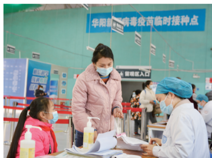
华阳南湖公园疫苗接种点为学生接种。

解封不解防，近来，华阳街道在四川天府新区的指导下，不断做好常态化疫情防控工作。自11月24日起，华阳街道组织辖区3岁至11岁的儿童集中接种新冠疫苗。自天府四小的学生们接种疫苗之后，11月25日，天府新区华阳实验小学的学生们也在家长、老师的陪同下来到南湖公园疫苗接种点有序接种，现场为小朋友接种疫苗的