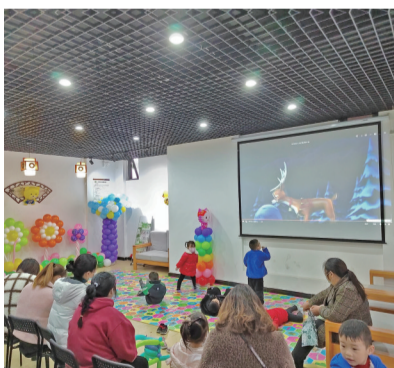
温江区接种点位布置得充满童趣。