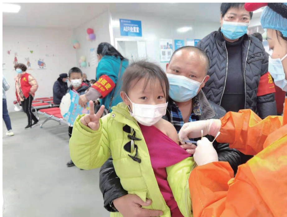
一边比“耶”,一边接种疫苗。