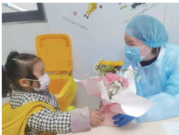
温江区接种现场,小朋友献花给医护人员。 详见02版