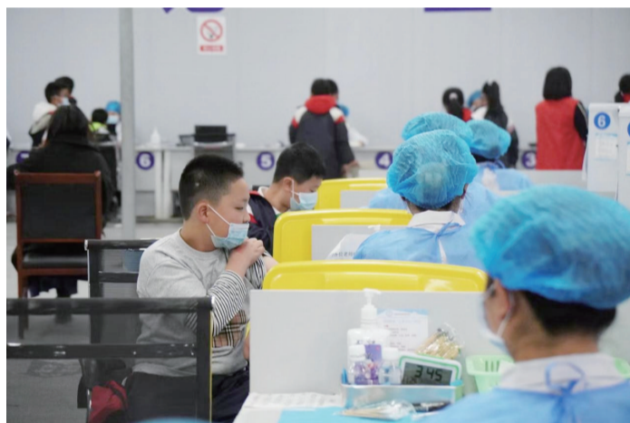
郫都区3-11岁人群新冠疫苗接种现场。