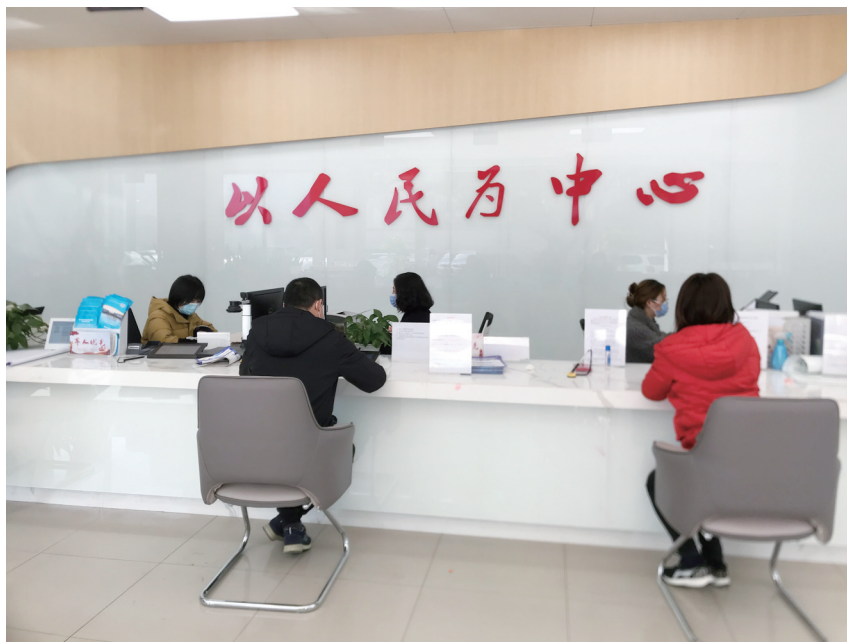
白头镇综合便民服务中心。

两项改革以来，崇州市审批局结合“15分钟公共服务圈”建设，构建了“15+11+172+4”服务体系，以15个综合便民服务中心、11个分中心、172个便民服务室和4个社区工作站（区域站），实现多层次全覆盖。在此基础