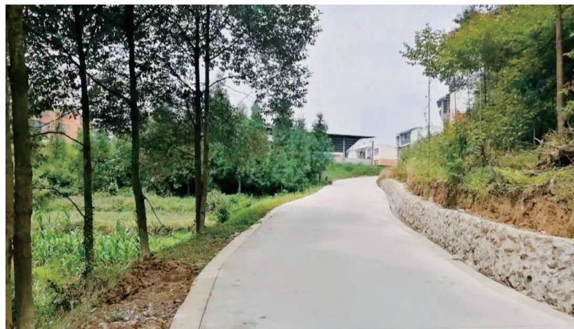
修好的平坦道路。

随着去年村(社区)体制机制改革完成,桂花镇庙坪村、涌华村与小石社区合并设立金城社区。过去分属两村