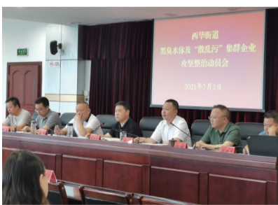
西华街道召开攻坚整治动员会。

河渠众多，水污染治理和消防安全治理压力巨大。为进一步提高辖区生态环境质量，改善涉农区域人居环境，西华街道将全力开展黑臭水体及“散乱污”集群企业整治百日攻坚行动，突出源头防控、精细化管控、全方位监控，制定方案、明确任务、挂图作战、倒排进度，以此力促