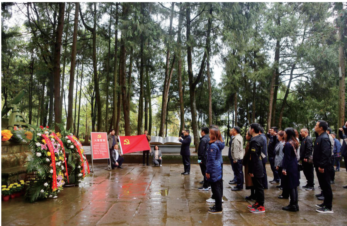
在烈士墓碑前庄严宣誓,重温入党誓词。

碑林纪念馆。珍贵的文物、感人的照片、震撼内心的历史故事,使大家的思想得到了净化和升华。