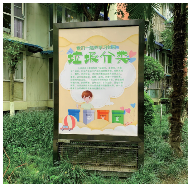
小区草坪上立着垃圾分类宣传海报。

小区草坪上立着一个广告牌,上写“垃圾要分类,生活要品味”,垃圾箱旁处可见有关垃圾分类的相关宣传……3月31日,记者走进成都市金牛区营门口街道长庆社区恒和华园小区,发现这里的垃圾分类氛围已十分浓厚。据了解,该小区属于垃圾分类“先行者”,早在今年年初就创立了一套机制流程。恒和华园小区是营门口街道的一个老旧小区,也是辖区垃圾分类的示范点位。小区内的“四分类”垃圾箱房已投入使用,每天7:00-9:00和19:00-21:30进行定时投放,小区内还有引导员、督导员进行宣传引导,“这些纸张属于可回收物,应当投入蓝色厢房;这个过期化妆品属于有害垃圾,应当投入第二个厢房……”志愿者定时定点,严格管控,答疑解惑,正是因为有志愿者们的加入,垃圾分类顺利地在小区推广开来。此外,不时有志愿者开展入户宣传、派发宣传资料,宣传垃圾分类知