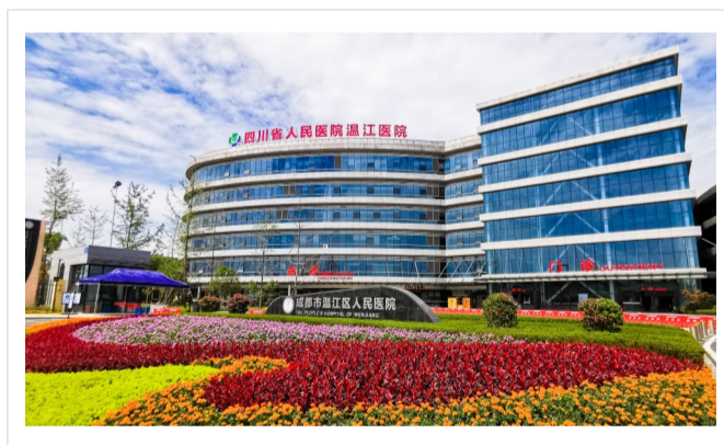
温江区人民医院新院区。

温江区卫健局充分发挥家庭医生团队协作作用，加强数字化全民健康档案建设，开展连续健康监测、疾病管理服务。同时，以健康管理带动基本医疗，将“健康管理与医疗服务”送进居民家中。针对失