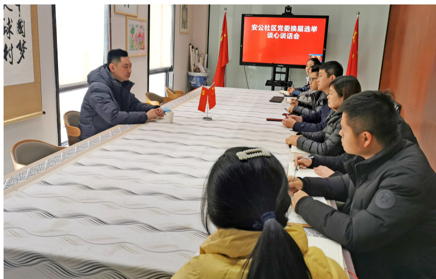
华阳街道纪工委坚持社区“两委”换届前谈心谈话。

区，督查换届风气，与社区党委、纪委深入交流，强调社区要严肃换届纪律，落实社区“两委”换届“十严禁”和“十不准”要求，让本届“两委”换届选出新班子、换出新气象。