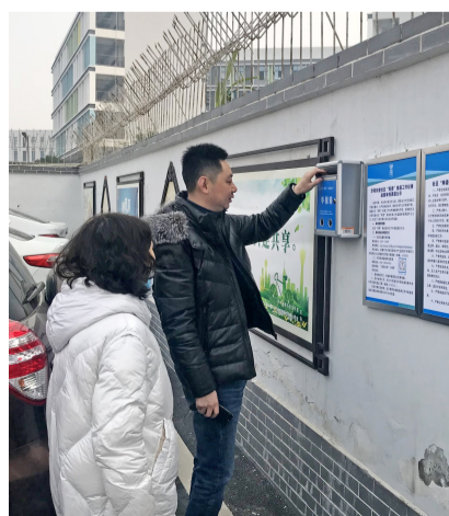
华阳街道纪工委人员查看举报箱。

“目前正是投票的关键时期，你们要注意监督，禁止拉票贿选。”近日，华阳街道纪工委相关人员走进辖区各社