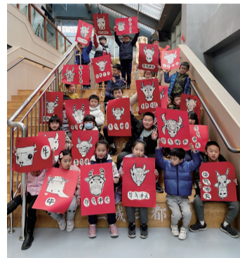
孩子们兴高采烈地展示自己的作品。

针对辖区内泛年轻化的现状,在智慧化大屏前,中心还一体化打造了社区微党校虚拟视觉VR体验区,摆脱形式单一的传统党员教育模式,采用年轻人喜闻乐见、寓教于乐的“沉浸式”体验方式开展党建党史、安全应急、公共卫生防疫等教育课程,提升党员教育和社区教育的参与性、趣味性、互动性。