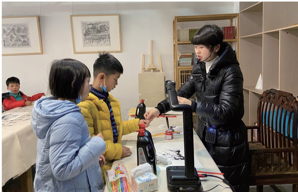
社区为小学生们开设公益课。

2月18日,成都市实施幸福美好生活十大工程动员大会召开,加快建成高品质生活环境新标杆和共建共享幸福城市新样本是十大工程的努力方向,其中“人人都享有幸福和美、安全稳定的美好生活”也正是汇泉路社区奋斗的目标。作为一个以新市民为主体构成的新建社区,汇泉路社区高屋建瓴,2020年8月投入使用6630平方米社区服务综合体,营造“闲有雅乐、学有优教、幼有善育、老有颐养”的锦江美好生活。