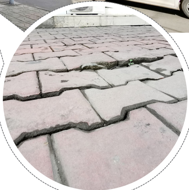
人行道许多铺砖已松动,路面坑洼不平。