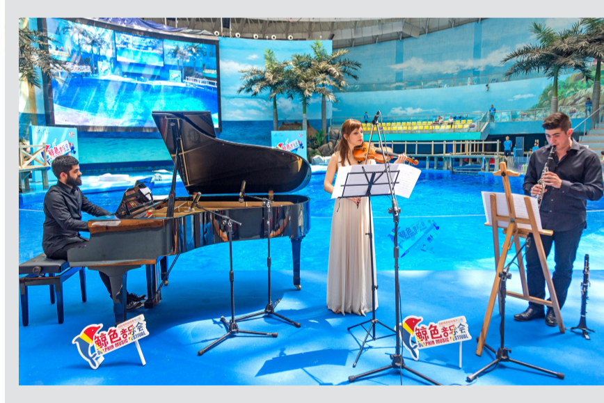
外国友人参加在社区举办的音乐会。

赠患病小朋友的生活费用。此外,引导社区倡导辖区商家店铺、企事业单位积极参与慈善帮扶活动。至今,共收到爱心捐款、爱心物资等价值8万余元。