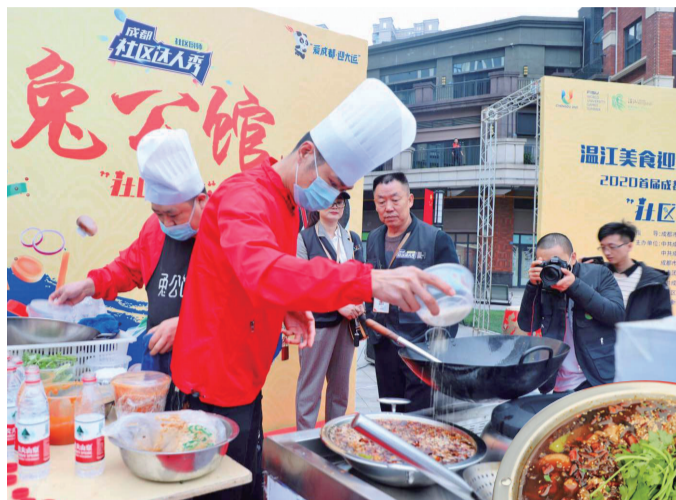
参赛选手现场制作美食。

第31届世界大学生夏季运动会的脚步越来越近，“爱成都·迎大运”的氛围也越来越浓。10月13日，2020成都社区达人秀温江公平专场活动迎来了“社区厨师”选拔赛。来自温江的大厨们携看家绝活儿“现炒现卖”，拉开了“温江美食迎大运”帷幕。爱成都迎大运，温江公平街道的方式是做一桌好菜欢迎世界宾朋。