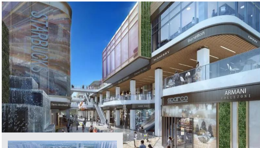
二江寺站TOD效果图一。

“项目周边社区建设成熟,而项目位于社区与轨道站点的必经之地,还能为本地区大量常住居民提供持续的消费服务。周边有一定的商业发展规