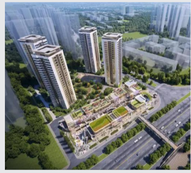
二江寺站TOD效果图二。