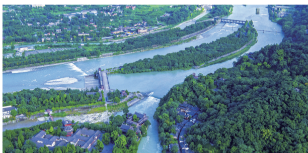
摄影作品《厉害了,我的堰》。

15年来,何勃用脚步丈量都江堰每一寸土地,用镜头记录都江堰市的变化。今年,他走遍了都江堰市的大小林盘,见证每一条绿道的诞生。“我的记录现在看上去也许意义不大,但是再