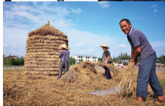
摄影作品《丰收盛景》。