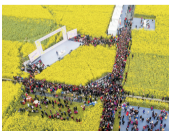
摄影作品《都江堰油菜花节》。