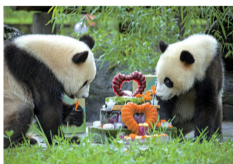
摄影作品《双胞胎大熊猫生日宴》。