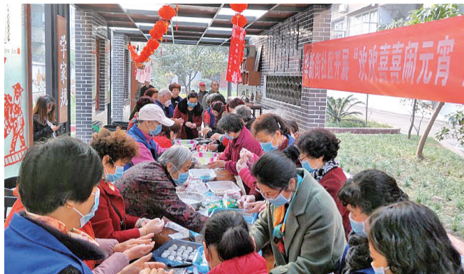
华新街社区宏益家园小区居民在小区内开展活动。

华阳街道作为天府新区的桥头堡，是展示公园城市形象的窗口。2017年9月以来，华阳街道党工委办事处认真贯彻全市城乡社区发展治理大会精神，聚焦“五大行动”，结合工作实际，提出了建设形态优美、服务完美、关系和美、人文善美、生活甜美“五美社区”总体思路。华阳街道党工委书记苟伟介绍，目前街道上下正着力推动老旧小区改造、特色街区打造、背街小巷治理、社区服务提升等工作，一个一个项目抓落实，确保城市变化更快，居民感受更深，努力把社区打造成为市民的美好生活家园。