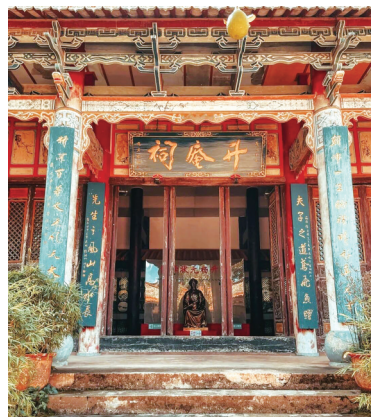
位于云南昆明西山区的升庵祠，现已是一座充满历史文化气息的博物馆。