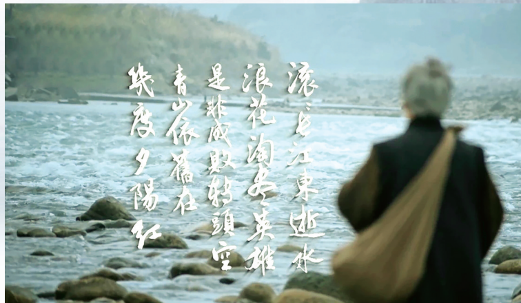
央视纪录片《杨升庵》。