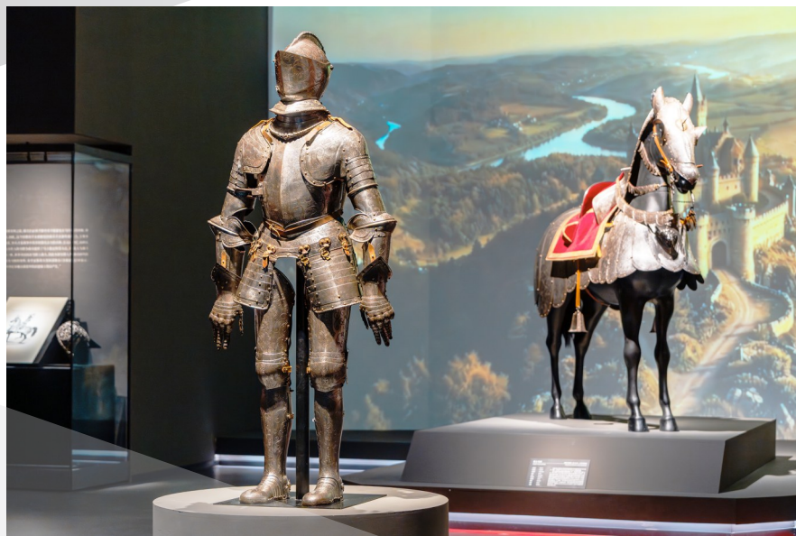
成都博物馆“钢铁与荣耀——意大利都灵王宫博物馆藏骑士文物展”。

博物馆”暑期系列教育体验活动，依托三星堆博物馆基本陈列及云冈石窟、朱炳仁熔铜艺术展两大临展，推出三星堆纸面具彩绘、金箔画制作、云冈石窟泥板画制作、非遗铜拓画制作等特色手工体验活动，让公众近距离感受古蜀文明及不同文化遗产的魅力。