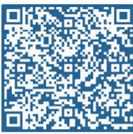
团体参赛扫码报名