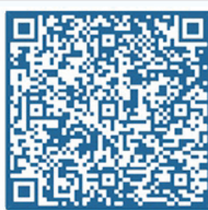
个人参赛扫码报名