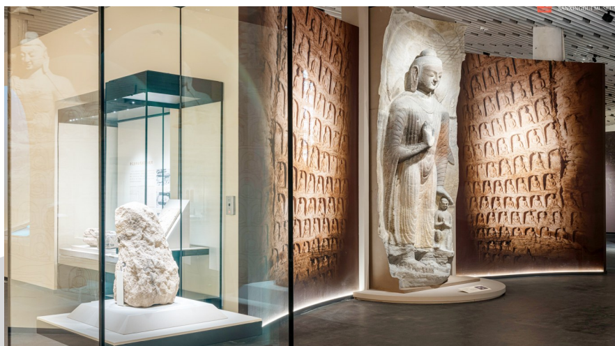
“云冈石窟：始建于北魏平城时代的世界文化遗产”特展正在三星堆博物馆举行。