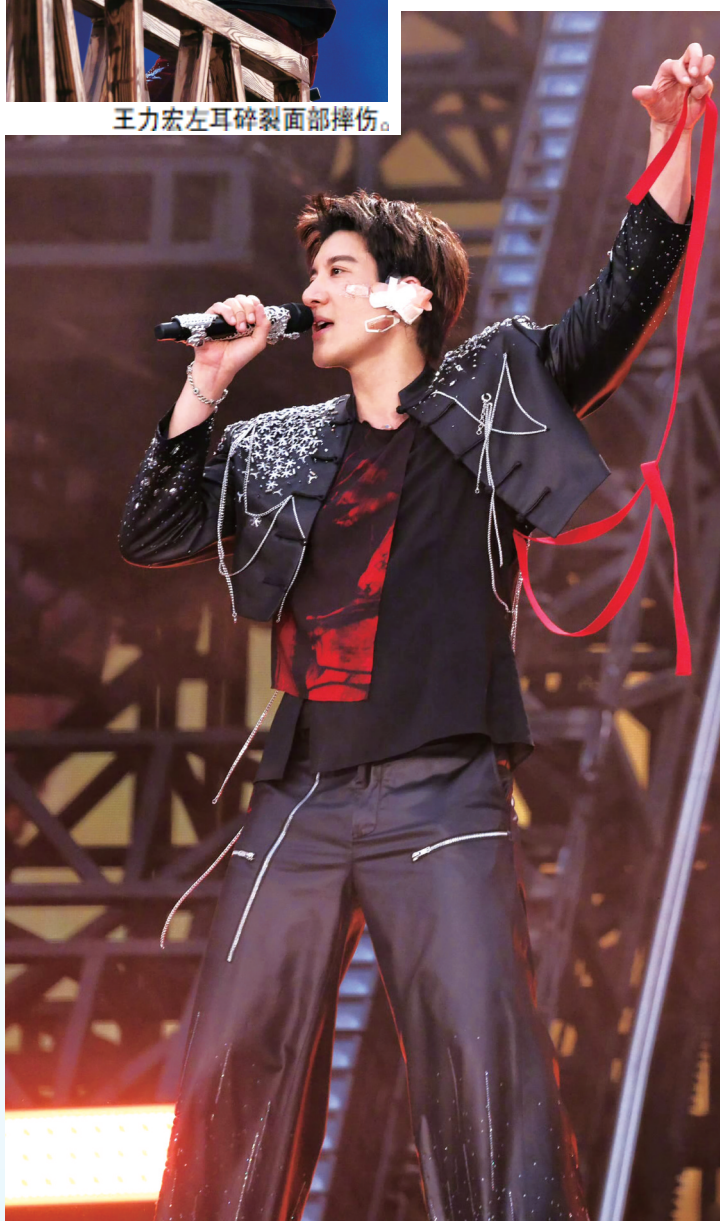
7月4日晚,王力宏受伤后经过简单包扎继续演唱。

7月5日的演唱会到了该环节时,工作人员解开王力宏安全带后递给了另一名工作人员,且阶梯装置处已经包裹上大量防撞软条。