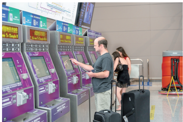
▲ 外国游客在成都地铁站买票。