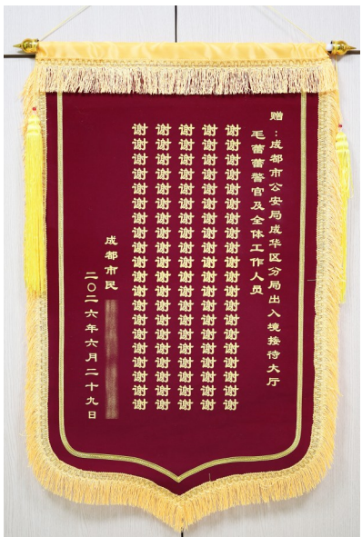
办事群众送来写有100个“谢”字的锦旗。