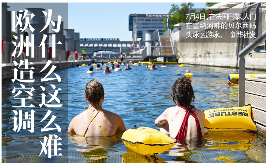
7月4日,在法国巴黎,人们在塞纳河畔的贝尔西码头泳区游泳。

有分析人士认为,欧盟对在历史建筑和老城区安装空调外挂存在一定限制,再加上近年来在节能环保领域不断收紧相关法规,也限制了空调的普及。不过,英国《卫报》指出,欧洲空调普及率低的根本原因还是需求不足、住房租赁比例高以及能源价格偏高,而非简单行政限制。随着热浪频发,欧洲正努力平衡制冷现实需求和节能减排法规。