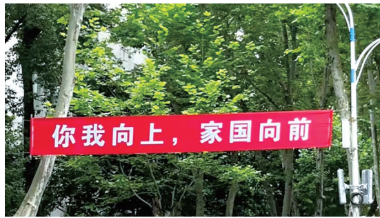
华中科技大学校园内拉起横幅,寄语即将走出校园的毕业生。