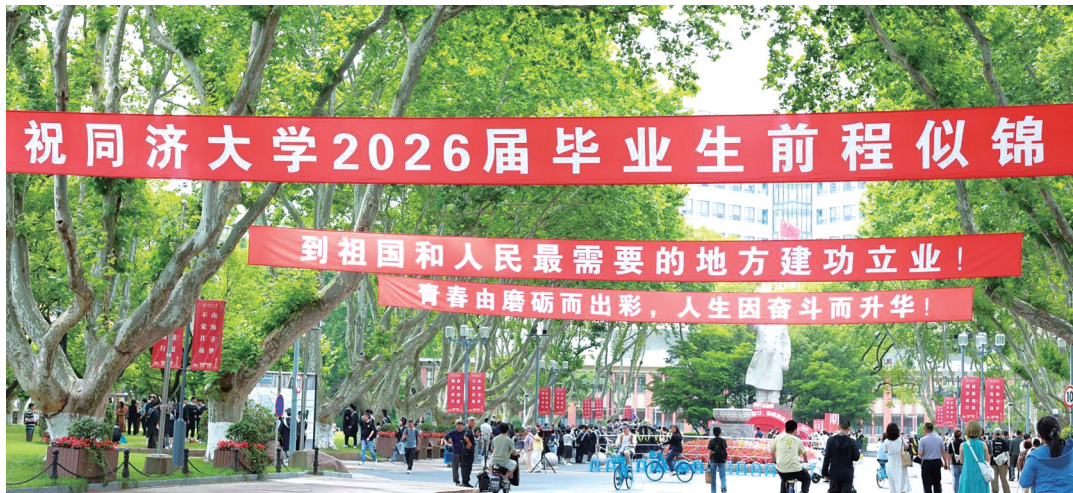
同济大学校园内的寄语横幅。