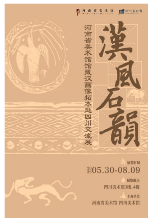
▲ 汉风石韵——河南省美术馆馆藏汉画像拓本赴四川交流展海报。