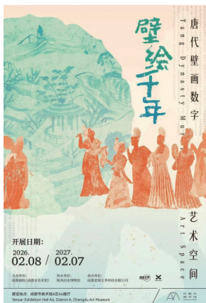
▲ 壁绘千年——唐代壁画数字艺术空间展海报。