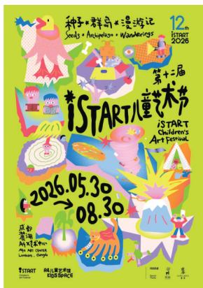
▲ iSTART儿童艺术节“种子·群岛·漫游记”海报。