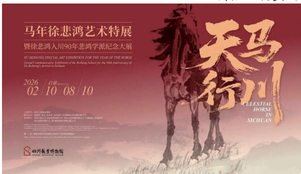
▲ 天马行川——马年徐悲鸿艺术特展暨徐悲鸿入川90年悲鸿学派纪念大展海报。