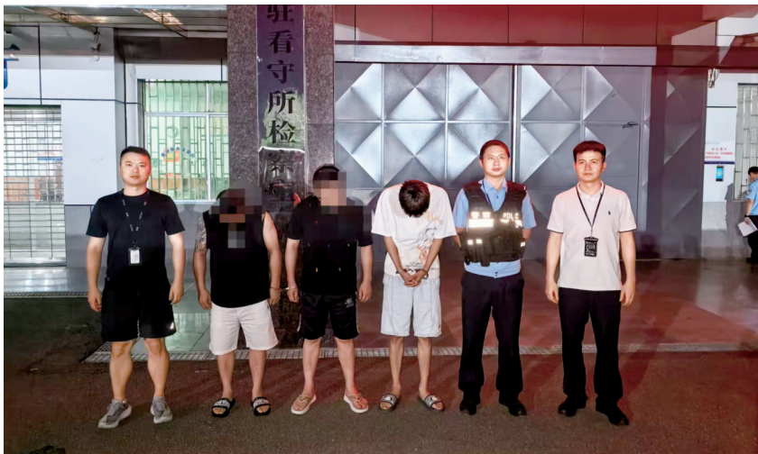
犯罪嫌疑人被警方抓获。

“团伙累计搭建用于赌球的微信群12个,现能查实的为2个,其余因涉赌已被平台封禁。查实的2个群内有参赌人员100余人。”民警介绍,团伙实行拉人头分层提成机制,介绍人按赌客单