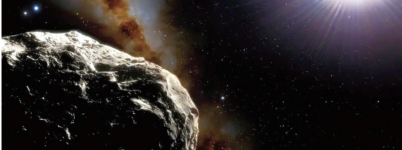
编号为2020 XL5的小行星构想图。