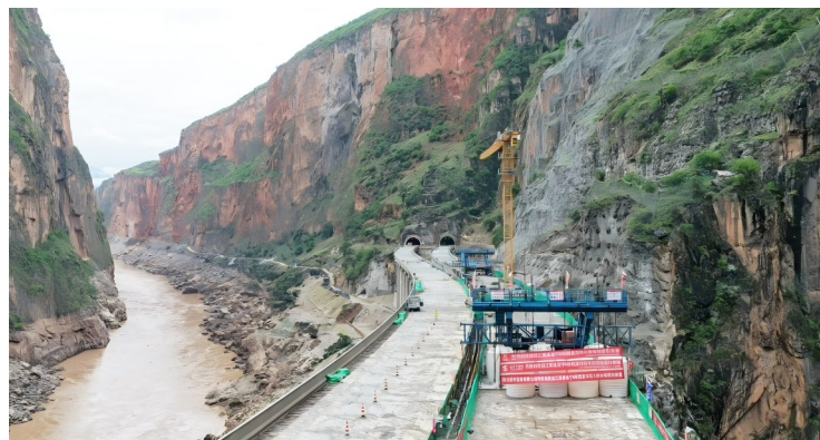
西溪河特大桥右线主桥中跨合龙现场。

临崖建桥坡度陡、难“站稳”怎么办？为了让大桥牢牢“长”在陡峭崖壁上，项目团队打出了一套“固桥+稳山”组合拳——优化桥梁基础设计，采用深嵌岩桩基将墩身与基岩紧密结合，相当于把桥墩牢牢插进山体中，同时搭配轻量化施工平台，减轻山体