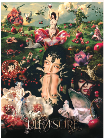
蔡依林成都站演唱会海报。