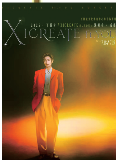
丁禹兮成都演唱会海报。