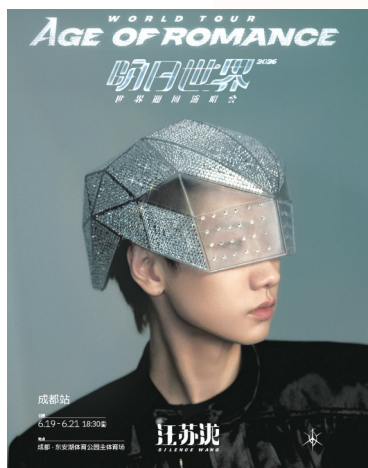
汪苏泷成都站演唱会海报。