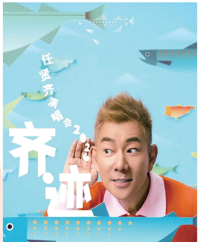
任贤齐“齐迹2026”巡演成都站海报。