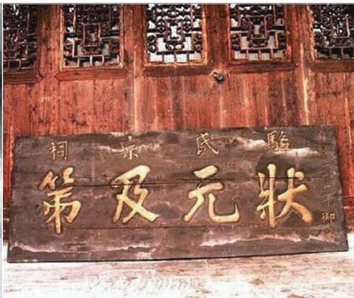
骆成骧及光绪皇帝题写的“状元及第”匾。