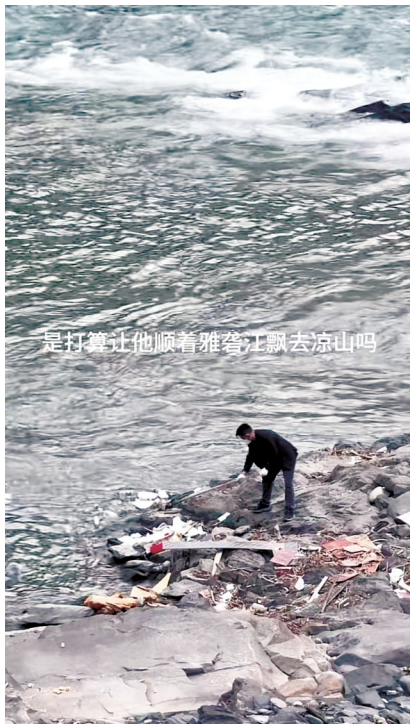
一男子在河道清理垃圾时，疑似把垃圾往河道里拨。游客发布视频截图

落实河长制工作决策部署，履行河湖管理保护主体责任，雅江县河长制办公室联合共青团雅江县委，组织水利局干部职工、青年“河小青”志愿服务队，沿雅砻江干流开展“践行河长制，