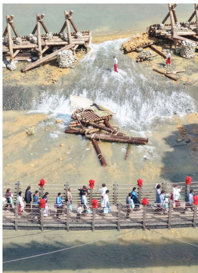
4月3日,在2026都江堰放水大典上,堰工砍断杙槎的绳索后,岷江水奔流而下。

6月13日是2026年文化和自然遗产日,“世界遗产保护利用主旨演讲”在峨眉山市举行。众多专家围绕“世界遗产的系统性保护与创新利用路径”,既回顾了峨眉山-乐山大佛申报世界遗产的来时路,也探讨了峨眉山生态系统的保护,更从运营利用方面谈到了世界遗产地如何在保护刚性约束下,走出一条可持续发展的、有品质的、不靠透支资源也能活得好的运营之路。