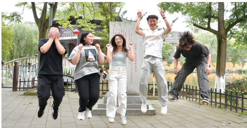
在“一百零八罗汉娃诞生地碑”前，5名“罗汉娃”合影。

3年前，刚刚踏入高中校园的时候，他还在为选择文科还是理科而纠结，如今参加高考，他走了艺术类，学习美声。“我想成为一名‘rap star’（说唱歌手）”，这是他现在的梦想，并且已经写