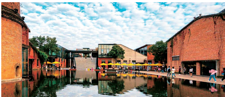
江西景德镇陶溪川文创街区。

它是中国最早远销海外的私人定制。自元朝起，江西景德镇便向欧洲大量出口瓷器，深刻影