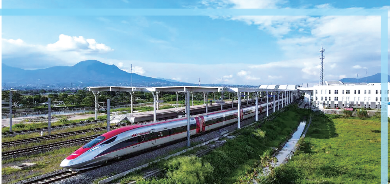
2025年5月20日，印度尼西亚万隆，一列雅万高铁高速动车组列车驶出德卡鲁尔站。

北欧地区此前从未发现如此规模的沉船宝藏，这一发现，再次刷新历史长河中，中国瓷器作为全球贸易硬通货、奢侈品的辉煌篇章。瓷器，是古代中国递给世界最亮丽的名片，任凭岁月更迭，“千年窑火”永续。