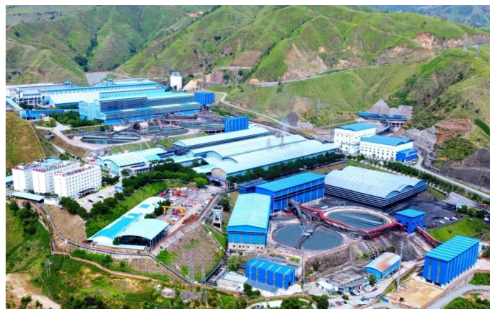
图据「攀枝花花开」微信公众号。龙佰四川矿冶有限公司二选厂。

该网友表示，他是二选厂员工，4月13日驾驶机动车在上述路段行驶时，被单位记录为超速，公司以“超速考核”为名，对他罚款300元，并从工资中直接扣除。该网友认为，事发路段为厂