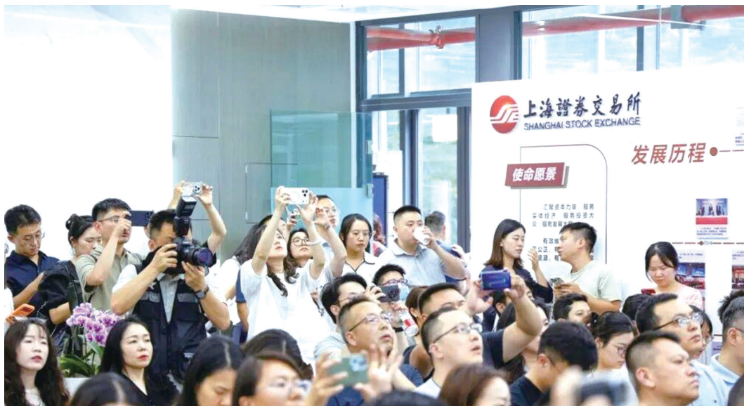
6月5日举行的“蓉策上新·惠企首发”——《成都市财政科技资金“先投后股”支持科技成果转化试点办法》政策解读暨现场对接活动。

有了空间，更要有人才与资金的“活水”。在人才培育上，《方案》鼓励在蓉高校强化多学科通识教育，依托高校建立科技商学院培养复合型人才，并聚焦电子科技大学电子信息、四川大学生物医药、西南交通大学未来