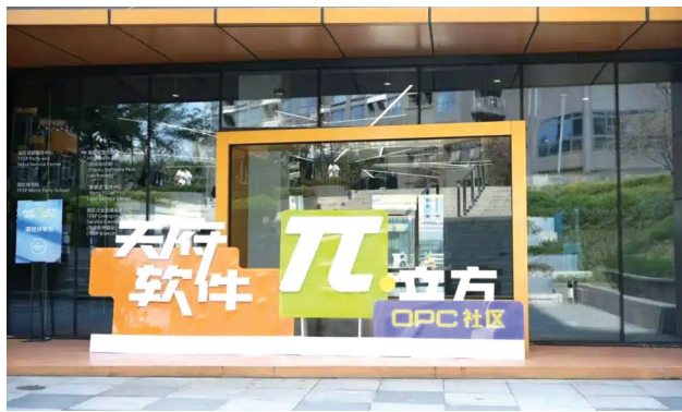
聚焦AI+数字文创的天府软件园π立方·OPC社区。