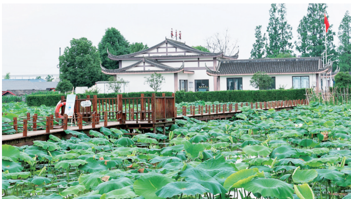
永丰村一角。

截至2025年底，眉山耕地保有量232.63万亩，粮食播面300.1万亩、产量129万吨；今年一季度，全市农村居民人均可支配收入增长6.8%，增速全省第一；建成全国乡村旅游精品线路，年均吸引游客超50万人次。