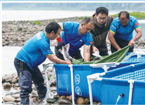
4月14日，在宜宾市江安县香炉滩水域，科研人员在放归带有超声波标记的长江鲟亲鱼前对其进行检查。