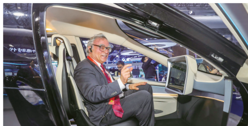
一名外国嘉宾在宜宾举办的2025世界动力电池大会上感受电动飞行汽车。