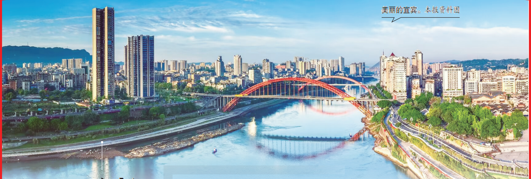
美丽的宜宾。