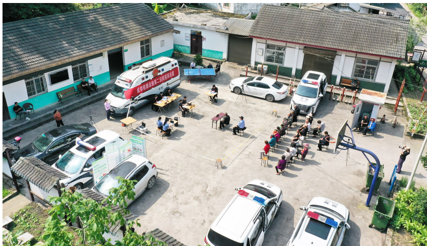
5月20日，一场和生态环境保护有关的庭审在北川羌族自治县永安镇永明村召开。