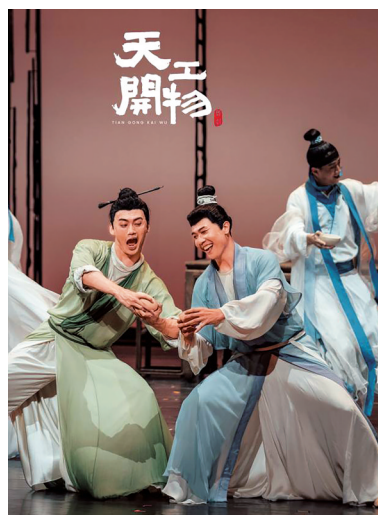
舞剧《天工开物》剧照。