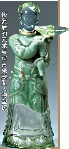
修复后的元龙泉窑青瓷露胎人物塑像