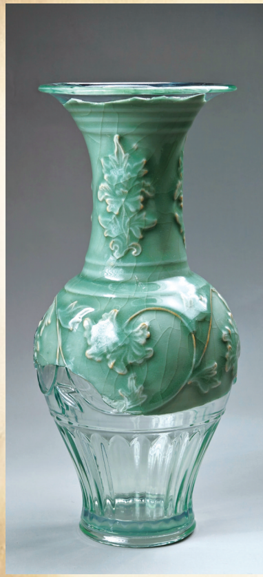
修复后的元龙泉窑青瓷缠枝牡丹纹凤尾尊