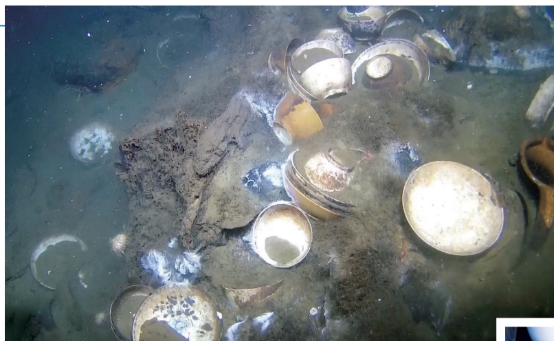
◀ 2026年1月14日 在挪威南部斯卡格拉克海峡拍摄的沉船中的中国瓷器。