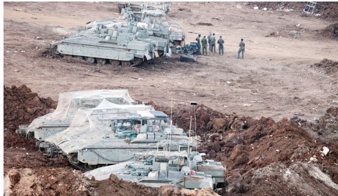
这是5月31日在以色列黎巴嫩临时边界以色列一侧拍摄的以军部队。

以方1日发表声明说，已下令以军对贝鲁特代希耶地区的黎巴嫩真主党目标发动空袭，并借由社交媒体警告当地居民尽快撤离。伊朗伊斯兰议会议长、伊美谈判伊方代表团团长卡利巴夫当天在社交媒体上表示，如果以方继续在黎巴嫩推进军事行动，伊朗不仅会停止当前与美国的谈判进程，还将“站出来对抗以色列”。卡利巴夫同日与黎巴嫩议会议长纳比·贝里通话时同样强调，伊朗