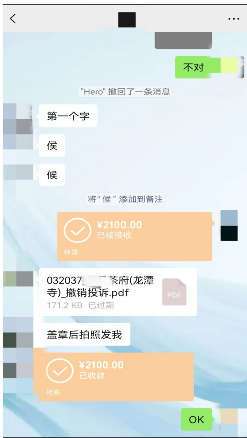
王女士选择私了，向举报者微信转账2100元。