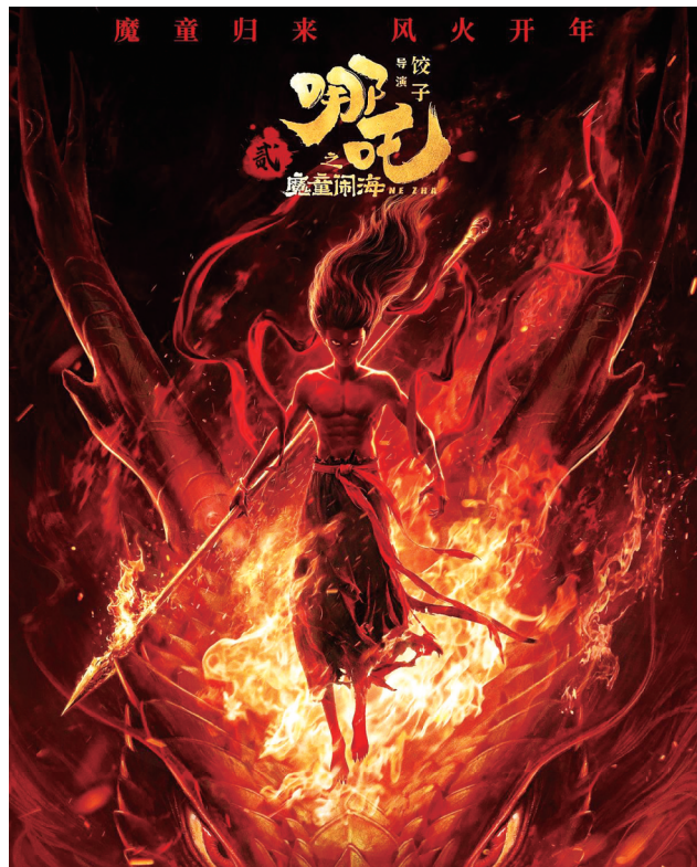
四川造动画电影《哪吒之魔童闹海》以全球超154亿元票房，登顶动画电影票房冠军。