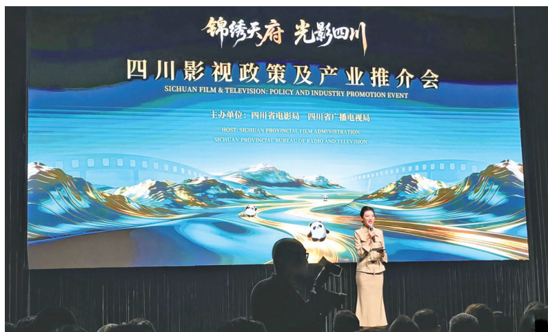
2026年3月17日，“锦绣天府·光影四川”四川影视政策及产业推介会在香港会议展览中心举行。