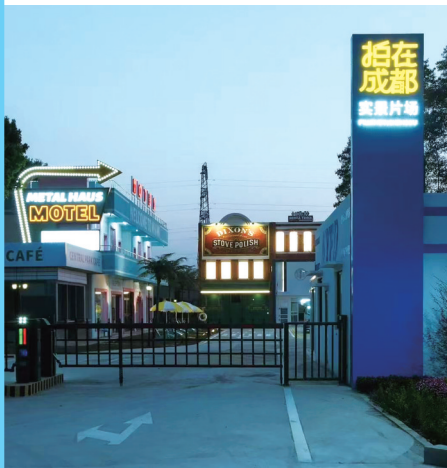
“拍在成都”实景片场。