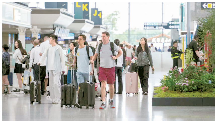
成都稳居入境游热门目的地TOP10。成都天府国际机场资料图

客源地的版图同样在扩展。越南、韩国、新加坡、美国、马来西亚、乌兹别克斯坦、加拿大、印度尼西亚、哈萨克斯坦稳居前列;而从增幅看,瑞典和芬兰游客的机票预订量同比增长均超过4倍,波兰、越南、丹麦超过2倍,瑞士、埃