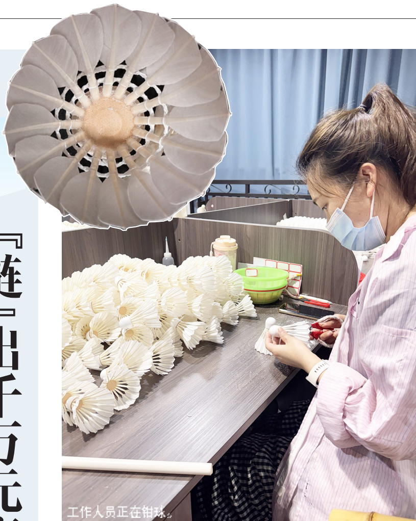
工作人员正在拍球。

2026年成都将举办国际赛事、全国性赛事以及省级赛事90余项。“赛事名城”的活力正强力撬动体育产业链集聚升级。