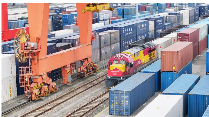
至2026年5月27日，“蓉深港图定班列”已开行一周年。

司多式联运部经理姚开玮介绍，“蓉深港图定班列”采用“定时、定点、定线、定价、定车次”的图定化运营模式，相较传统公路运输的