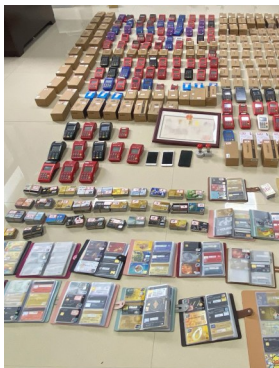
射洪警方查获的信用卡和POS机。