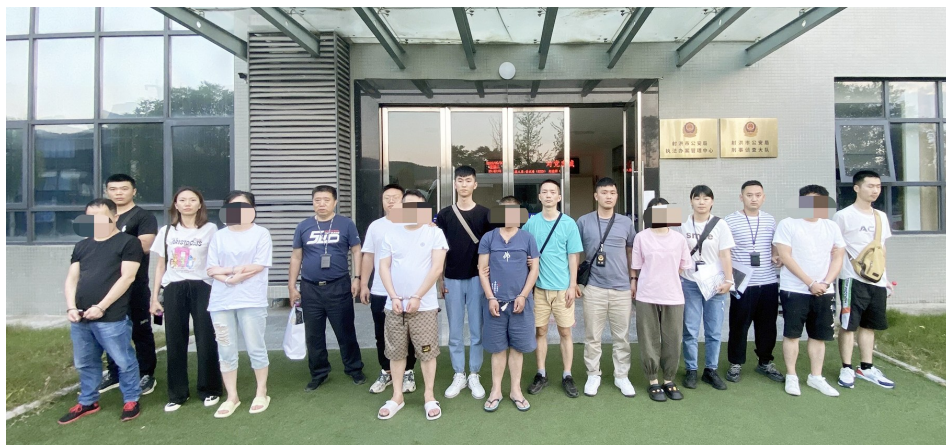
犯罪嫌疑人被警方抓获。