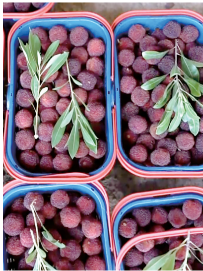
图为福建漳州的杨梅。

龙海浮宫是福建省杨梅核心产区，杨梅种植面积超4万亩，“浮宫杨梅”被授予国家地理标志保护产品称号。近年来，当地推广生态种植技术，大力发展精深